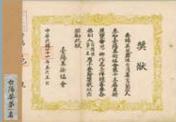
1962.5.6雕塑作品【思鄉】獲臺灣美術協會第15屆美術展覽會「台關獎第一名」。